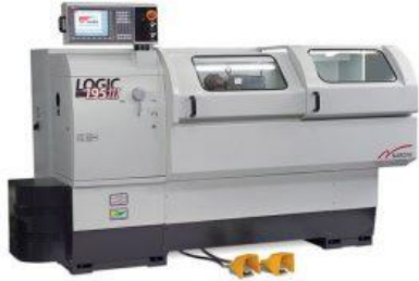
Tornos CNC Nardini