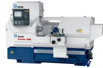
Tornos CNC Romi